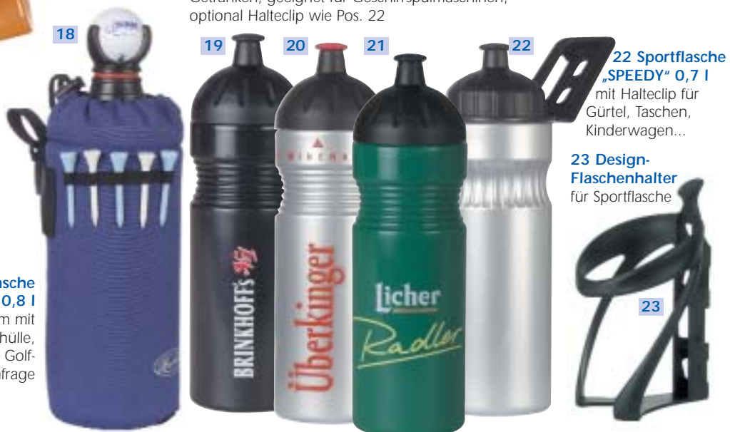
19-21 Sportflasche „SPENDER“ 0,5/0,7 l geruchs- und geschmacksneutral, dicht auch bei leicht kohlenensäurehaltigen Getränken, geeignet für Geschirrspülmaschinen, optional Halteclip wie Pos. 22