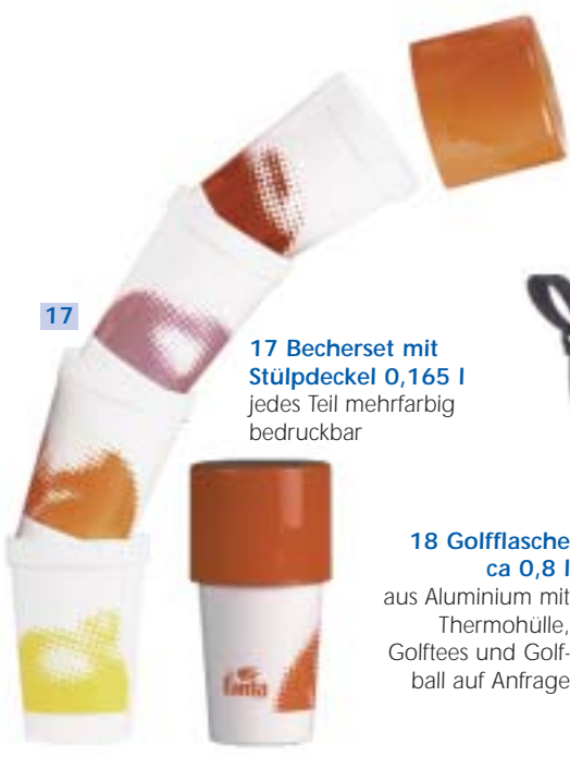
17 Becherset mit Stülpedeckel 0,165 l jedes Teil mehrfarbig bedruckbar