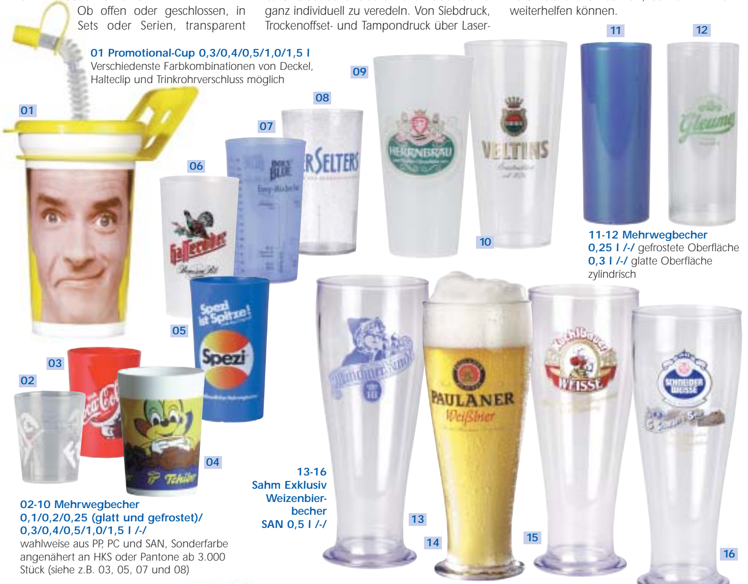
01 Promotional-Cup 0,3/0,4/0,5/1,0/1,5 l Verschiedenste Farbkombinationen von Deckel, Halteclip und Trinkrohrverschluss möglich

beschriftung/-gravur bis hin zum Heißprägen. Grundsätzlich ist jede Farbe und Farbkombination je nach Produkt auch bei einer kleinen Auflagenmenge realisierbar. Rufen Sie uns einfach an, damit wir Ihnen weiterhelfen können.