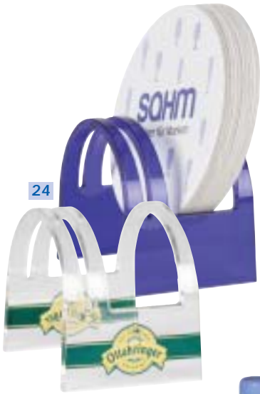
24 Bierdeckel- und Speisekartenständer „CARDY“