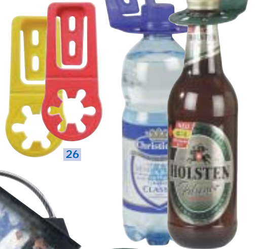
26 Universalhalteclip „BOTTY“, auch für Dosen „TINNY“