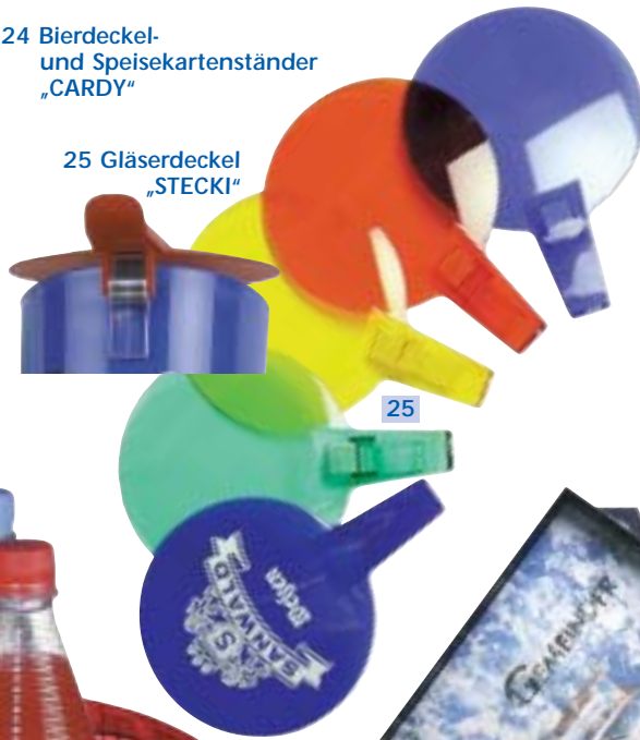
25 Gläserdeckel „STECKI“